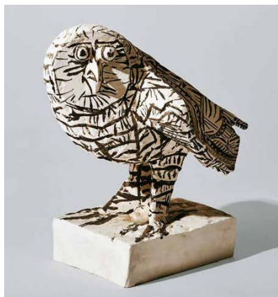
Pablo Picasso (1881-1973), La Chouette, 1953, terre cuite moulée peinte, 34 x 26 x 37 cm.

Dans la catégorie animalière, la galerie propose la charmante découverte de La Guenon et son petit , réalisée en 1951, montrant avec quelle facilité Picasso s'emparait des objets de son environnement (roues, anses de tasse, amortisseur de voiture...). Le bestiaire mythologique trouve également sa place dans ce panorama, notamment dans la figure du Minotaure, quintessence de l'iconographie