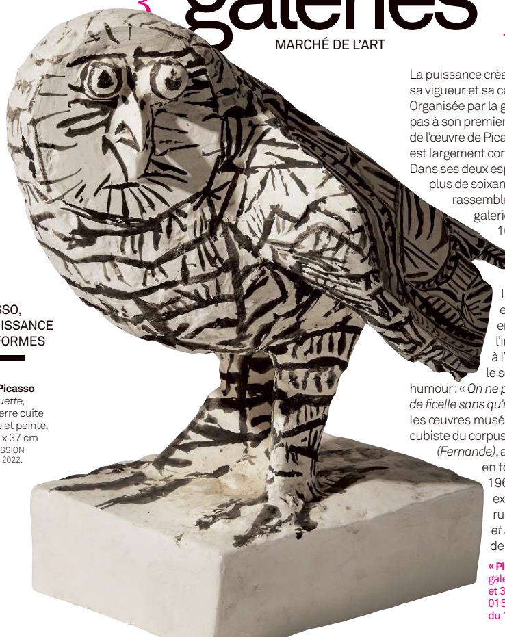
PICASSO, LA PUISSANCE DES FORMES

Pablo Picasso La Chouette , 1953, terre cuite moulée et peinte, 34 x 26 x 37 cm ©SUCCESSION PICASSO 2022.